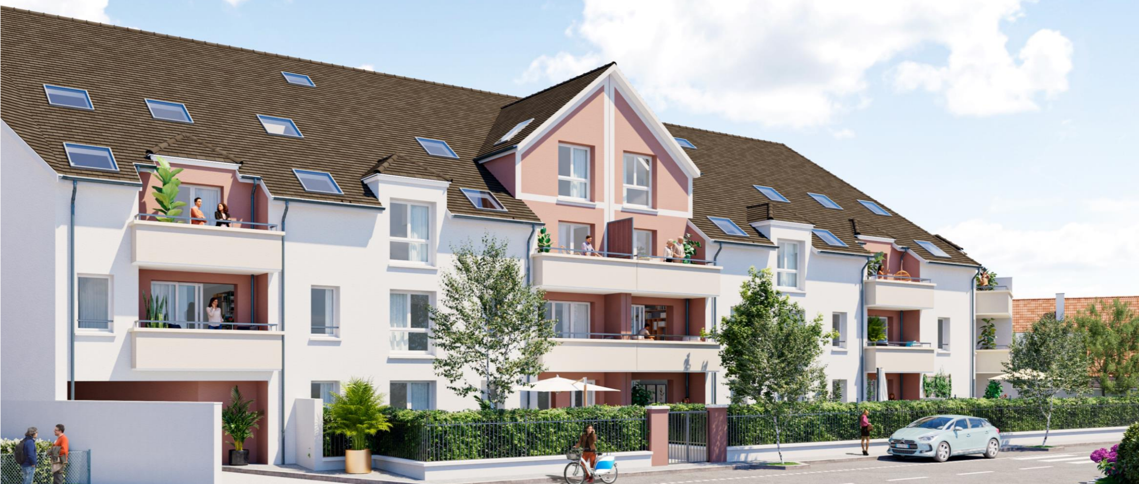
LOUVRES, UNE PETITE VILLE AU NORD DE PARIS