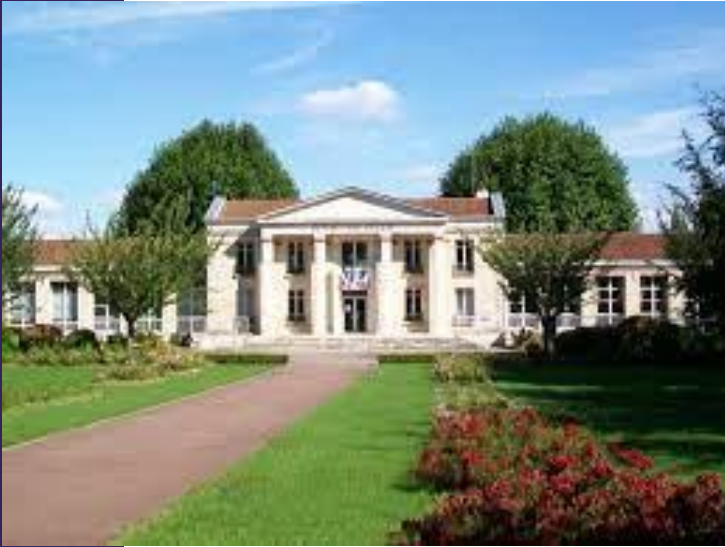
Mairie de Louvres