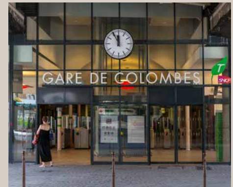
Gare de Colombes

Pour vos courses du week-end, rendez-vous au marché de Bois-Colombes ou dans la rue commerçante des Bourguignons, un quartier vivant et pratique avec ses brasseries, pharmacies, banques, commerces... Profitez aussi des enseignes nombreuses de la rue piétonne Saint-Denis au centre-ville. Pour vos enfants, petits et grands, vous rejoignez crèche, écoles, groupe scolaire, lycée, gymnase, dans un rayon de quelques centaines de mètres à peine.