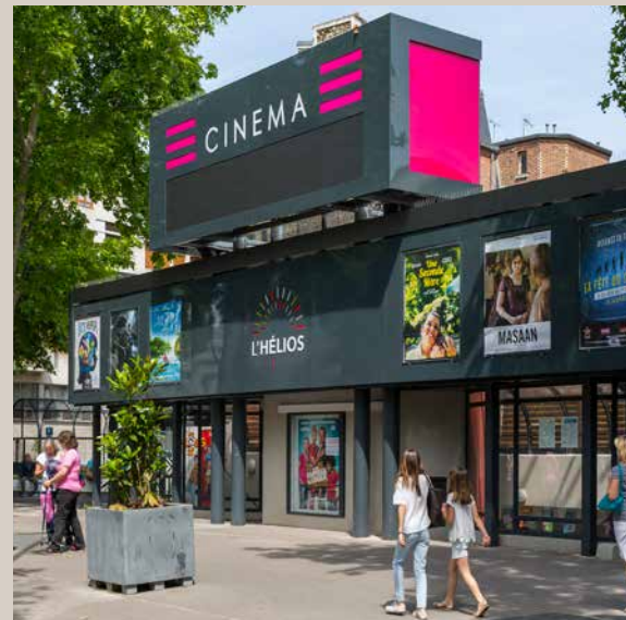
Cinéma, rue de Bournard