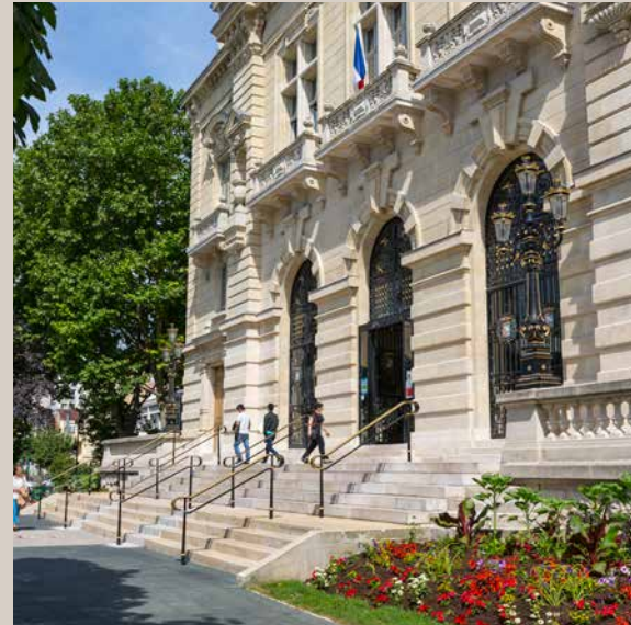
Hôtel de ville

UNE VISION CONTEMPORAINE ET HARMONIEUSE DE LA VIE