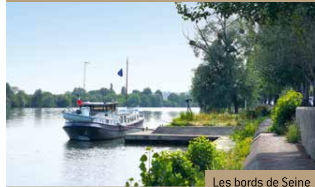
Les bords de Seine