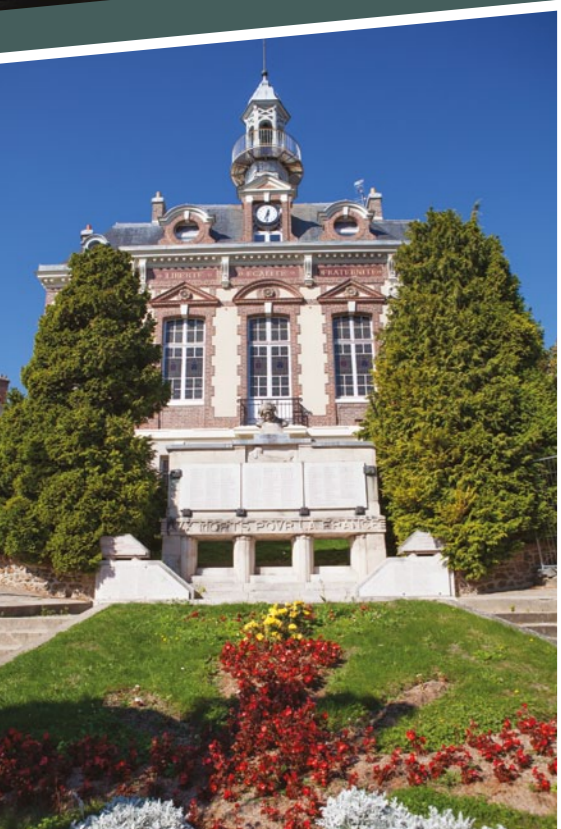
Académie des Arts