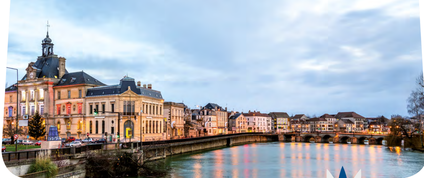
BORDS DE MARNE