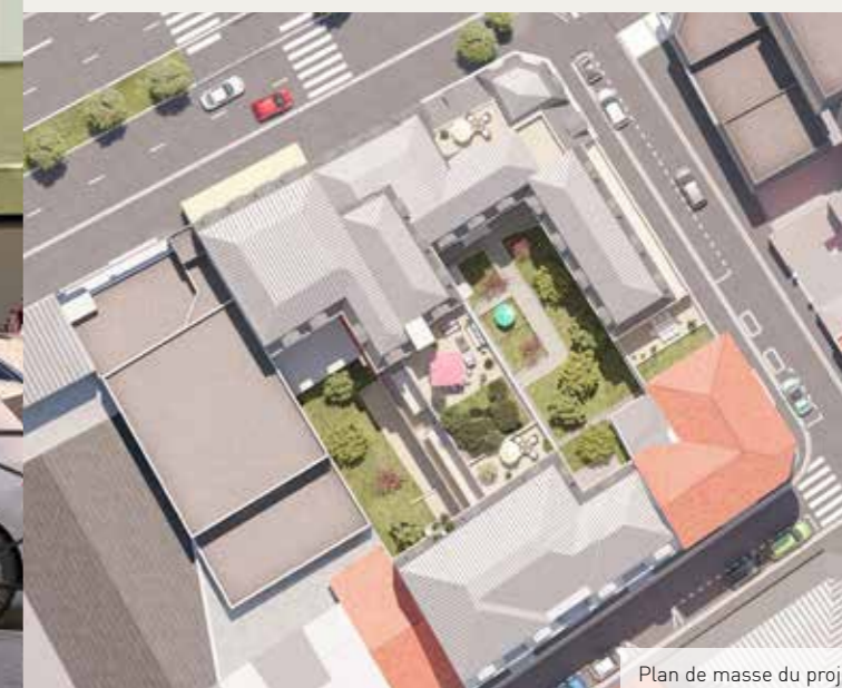
Plan de masse du projet