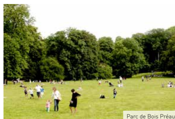
Parc de Bois Préau